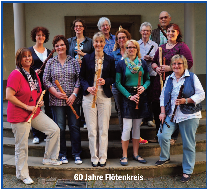
60 Jahre Flötenkreis

Gemeindeforum zur Kooperation mit Königsborn am 9. April um 19 Uhr im Melancthon-Haus