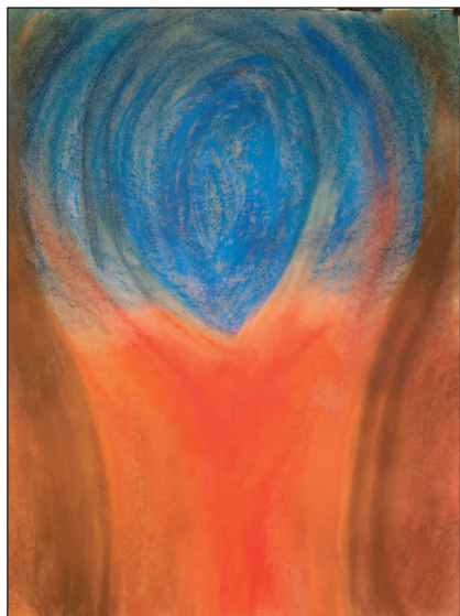
Jeder Mensch hat einen Himmel über seiner Wunde.

Wenn ein Mensch stirbt, hinterlässt er sehr häufig andere Menschen, die weiterleben und um den Verstorbenen trauern. Die Angehörigen müssen mit dem Verlust fertig werden. Trauerarbeit ist nicht mit der Beerdigung zu Ende, sondern beginnt dann eigentlich erst.