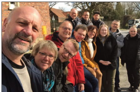
Gruppenselfie: In Billmerich traf sich die Gruppe der Macher der „Geistlichen Impulse“ zum Austausch und zur Planung.