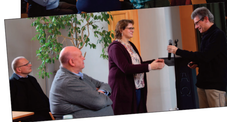
Neujahrsempfang im Melanchthon- Haus