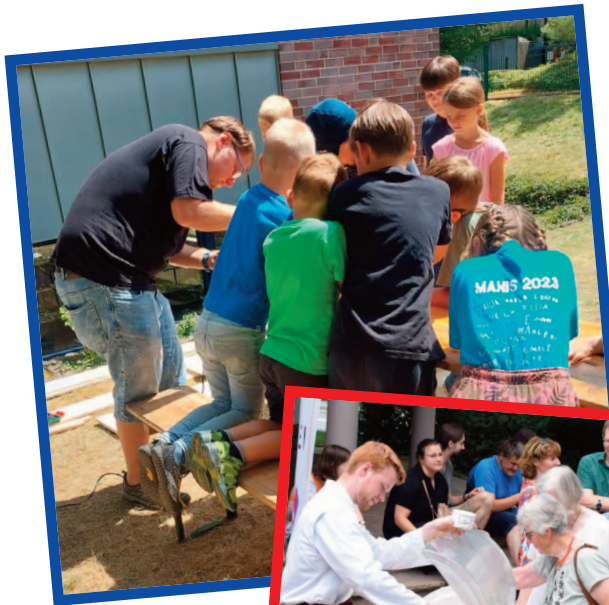
Linke Seite: Kinderferienspaß (Oben)