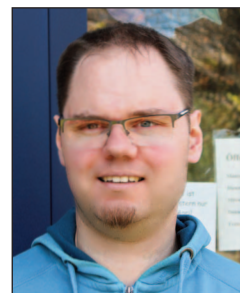
Angedacht von Malte Hinz Jugendreferent

„Dies ist die Zeit, um sich nur dem Moment hinzugeben. Dies ist die Zeit, um ihn so wie er ist zu erleben“ haben die Wise Guys mal gesungen. Einige kennen sie vielleicht noch von Kirchentagen. Ich finde, da steckt viel Wahres drin. Oft leben wir viel zu schnell. Ein Termin jagt den nächsten und wir sind häufig nur unterwegs. Oft ist es besser, sich Zeit für etwas zu nehmen. Zeit für ein kurzes Innehalten, für ein kurzes Gebet. Zu häufig geht das in meinem Alltag unter. Die Bibel sagt dazu: Alles hat seine Zeit. Und ein paar Verse weiter: Gott hat alles schön gemacht zu seiner Zeit. Das zeigt doch, wie es gehen kann. Sich Zeit zu