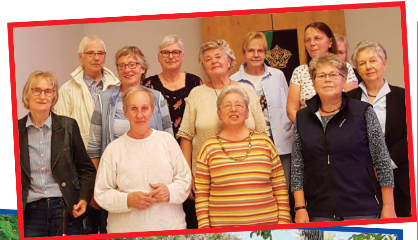
Rechte Seite: Frauengesprächskreis in der Synagoge (Oben) Männerkreis in Ochsenfurt (Mitte) Geburtstagsfest (Unten)