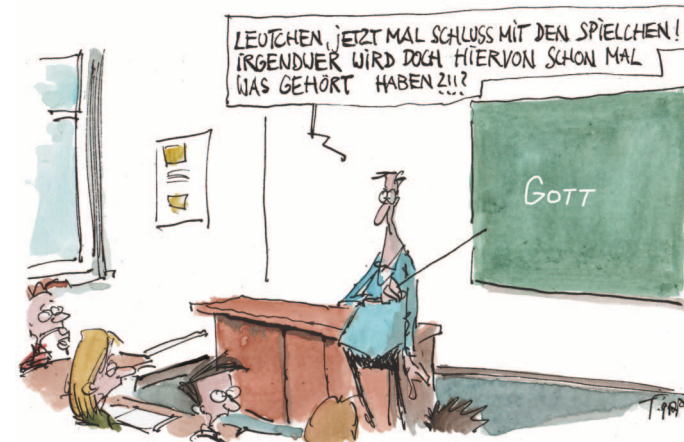
RELI, ERSTE STUNDE - NACHDENKLICH STIMMENDE SZENE

am 6. Dezember von 16 - 19 Uhr Kontakt: Stella Wagner Handy: 0177 / 8 64 37 85 weitere Termine siehe Homepage und Aushänge