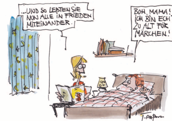
ABENDS, HALB NEUN IN DEUTSCHLAND - BEDRÜCKENDE SZENEN