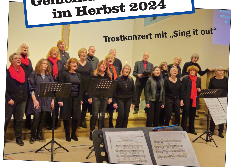
Trostkonzert mit „Sing it out“